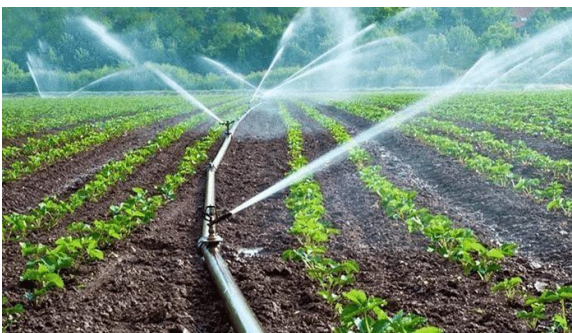
Riego por aspersión

En el riego por aspersión, el agua va a presión por las cañerías hasta llegar a los aspersores. Los aspersores echan el agua en forma de lluvia.