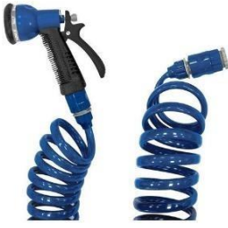
Pistola o lanza de la manguera

También podemos poner un aspersor en la manguera de riego.