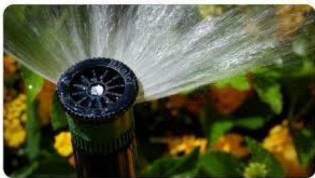
Un difusor riega un jardín

Los difusores no giran, solo echan agua en la zona cercana. Para determinar la zona cercana en la que regar, hay que regular la boca de salida.