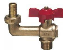
Una boca de riego

Una boca de riego es un conducto en el que se enchufa la manguera para regar.