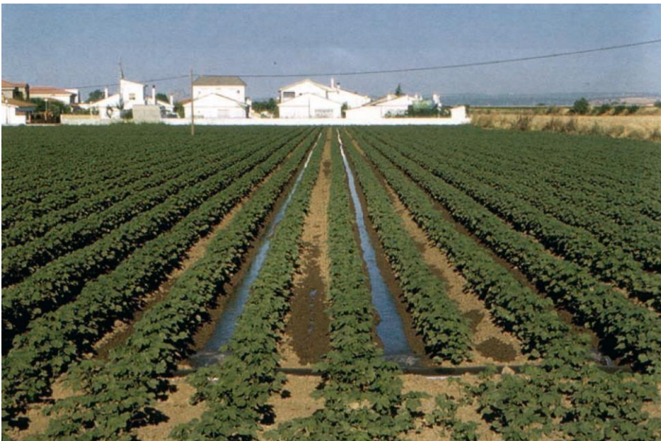
Riego por superficie

En la siguiente fotografía, puedes ver un ejemplo de riego por superficie. En el suelo, hay surcos y caballones.