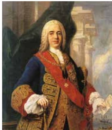
Don Zenón de Somodevilla, Marqués de la Ensenada. Anónimo, siglo XVIII, colección particular.