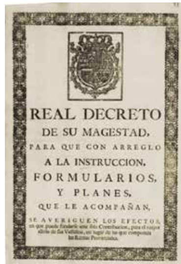
Portada del Real Decreto de 10 de octubre de 1749 por el que se puso en marcha el Catastro de Ensenada.

El 10 de octubre de 1749 se promulga el real decreto que pondrá en marcha la realización del Catastro —en el sentido de averiguación o pesquisa — en los territorios peninsulares de la Corona de Castilla. Se realizó desde la primavera de 1750 hasta mediados de 1756, aunque el Catastro de la Villa y Corte se prolongó hasta 1757. Pero ¿por qué y para qué propone Ensenada al rey la realización de un Catastro en Castilla? La razón fundamental que movió al Ministro, y de la que muchos participaban, fue que el entramado fiscal era radicalmente injusto al no existir equidad, pues no había la menor correlación entre lo que se poseía o las rentas que se obtenían y las cantidades con las que se contribuía. Estando como estaba buena parte de la renta nacional en manos de los dos estamentos privilegiados —nobleza y clero—, el grueso de las contribuciones procedía, sin embargo, del llamado estado general , el pueblo llano , los homes buenos , los pecheros . Como gran parte de los tributos se recaudaba mediante imposiciones o sisas sobre los consumos , los privilegiados quedaban de hecho exentos al disponer de cosechas propias, con lo que dos de los ramos más onerosos y denostados, los llamados millones y los cientos , pesaban casi exclusivamente sobre el estado general. La reforma que Ensenada propone quiere poner remedio a todo ello, pero para gravar a cada uno según lo que