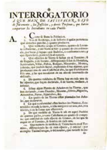
Primeras preguntas del Interrogatorio al que respondieron las casi 15.000 poblaciones castellanas (AGS).