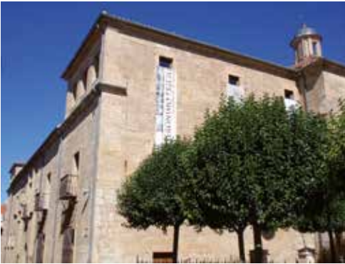
Fachada del Palacio de los Águila , sede de la exposición temporal.

Viernes 10: Conociendo los espacios militares y civiles de la Ciudad Rodrigo del siglo de las Luces . LAURA GARCÍA JUAN. Profesora ayudante doctor de geografía humana. Departamento de Geografía, Universidad Autónoma de Madrid.